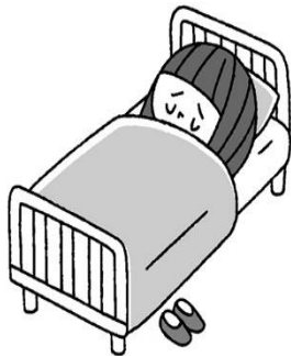
ぐあい わる 具合が悪いとき いちじてき きゅうよう 一時的に休養できる