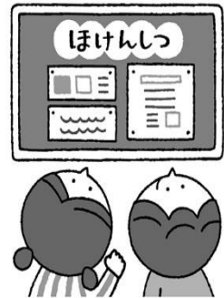
けんこう 健康について し 知りたいとき

※ 心の悩みの相談は、スクールカウンセラーの先生が水曜日と金曜日に学校に来ています。