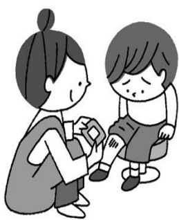
ケガをしたとき きゅうきゅうしよち 救急処置してもらえます