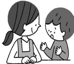
なや 悩みがあるとき そうだん 相談できる