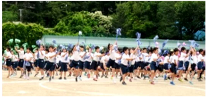
2年 「わくわく♪わかぼのたからじま」