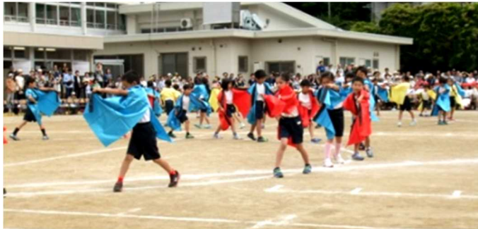
3年 「AGEHA～Burn the mind～」