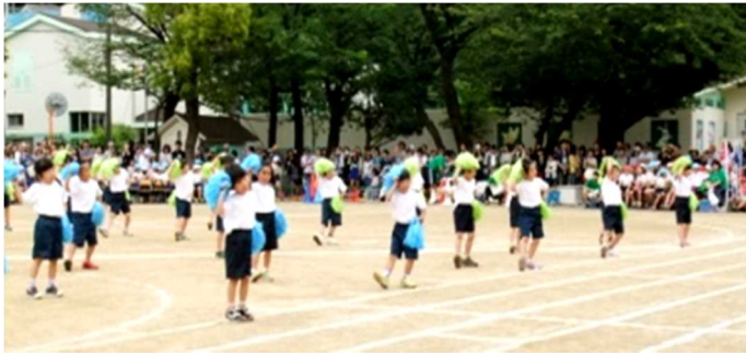
1年 「えがおでやってみよう！」