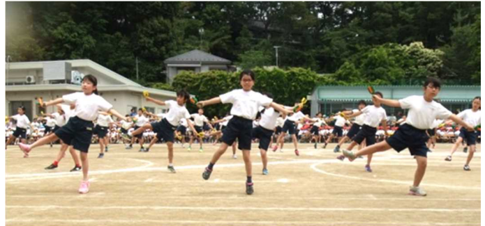
4年 「輝け！ヨッシャ来い！」