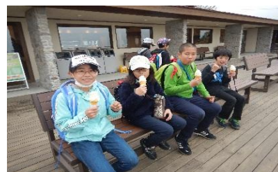
おいしい！！ソフトクリーム

三日間 仲が深まる ハケ岳 たからもの 友との思いで 三日間 山頂へ 絶景目指して 汗にじむ 風そよぎ 歩いて自然と ハイタッチ 牧場で いろんなことが 知れたよね わすれない みんなと過ごした 三日間 ハイキング 自然がいっぱい すてきだな ハケ岳 自然がいっぱい あふれてる ぼくたちは 心と体 成長したよ みんなとね すごした時間 宝物 三日間 たくさん思い出 作ったよ しし岩の 手元に広がる 光る石 みんなの仲 もっと深めたい ハケ岳 たっせいかん 素敵な景色は 山頂で 飯盛山 木のトンネルと 険しい岩 自然の中 心がすごく やすらいだ しし岩で みんなにほほえむ 輝石だよ 山登り 輝石拾いに ハイキング 火のひかり 地から天まで のぼりける 火のまわり みんなでうたって えがおだよ 最後まで みんなでやった ハケ岳 やみのなか みんなをてらすよ ほのおたち ともだちと 山みちあるいた 思い出だ ハイキング タヌキ・キツネの あしあとだ ピカピカの 星のかんさつ 楽しそう ホルスタイン おいしい牛乳 ありがとう 手作りで もちもちしてた ほうとうだ 山登る きつかったけど たっせいかん 東京とは 大ちがいの 大自然 たくさんの 宝の緑 ハケ岳 いいけしき のぼってよかった 飯盛山 もう終わり 思い出つくった 三日間 輝石拾い 見つかるかなあ ワクワクだ 山道で 友の優しさ あたたかい