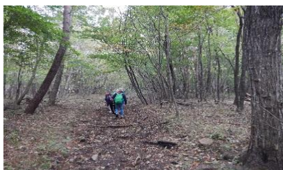
清泉寮ハイキング