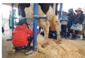
ハケ岳牧場 乳搾り体験

三日間 仲が深まる ハケ岳 たからもの 友との思いで 三日間 山頂へ 絶景目指して 汗にじむ 風そよぎ 歩いて自然と ハイタッチ 牧場で いろんなことが 知れたよね わすれない みんなと過ごした 三日間 ハイキング 自然がいっぱい すてきだな ハケ岳 自然がいっぱい あふれてる ぼくたちは 心と体 成長したよ みんなとね すごした時間 宝物 三日間 たくさん思い出 作ったよ しし岩の 手元に広がる 光る石 みんなの仲 もっと深めたい ハケ岳 たっせいかん 素敵な景色は 山頂で 飯盛山 木のトンネルと 険しい岩 自然の中 心がすごく やすらいだ しし岩で みんなにほほえむ 輝石だよ 山登り 輝石拾いに ハイキング 火のひかり 地から天まで のぼりける 火のまわり みんなでうたって えがおだよ 最後まで みんなでやった ハケ岳 やみのなか みんなをてらすよ ほのおたち ともだちと 山みちあるいた 思い出だ ハイキング タヌキ・キツネの あしあとだ ピカピカの 星のかんさつ 楽しそう ホルスタイン おいしい牛乳 ありがとう 手作りで もちもちしてた ほうとうだ 山登る きつかったけど たっせいかん 東京とは 大ちがいの 大自然 たくさんの 宝の緑 ハケ岳 いいけしき のぼってよかった 飯盛山 もう終わり 思い出つくった 三日間 輝石拾い 見つかるかなあ ワクワクだ 山道で 友の優しさ あたたかい