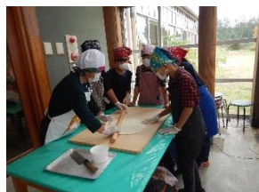
ほうとう作り 体験