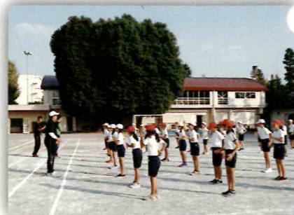
オリンピックパラリンピック教育