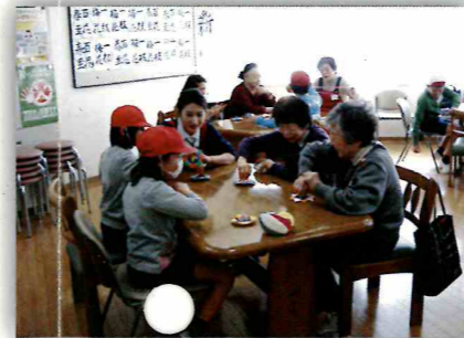
ふれあいさん交流