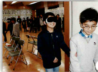
アイマスク福祉体験