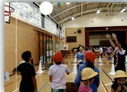
ハチの子全校集会