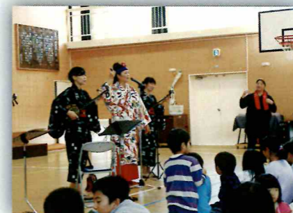
PTA コンサート「音もだち」