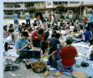
健全育成 〈キャンプ〉