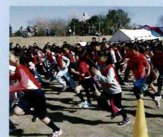
健全育成 〈4地区耐寒マラソン大会〉