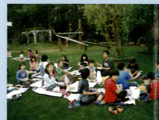
〈年3回ハチの子青空給食〉