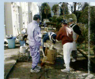
学校開放委員会 〈もちつき大会〉