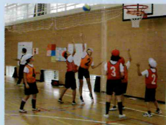
〈バスケットボール〉