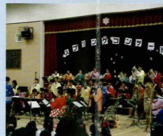
PTA 〈スプリングコンサート〉