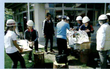
〈調布市防災教育の日〉