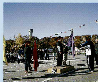
学校開放委員会 〈地域運動会〉