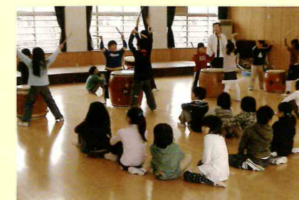
〈たけのこ学級との交流〉