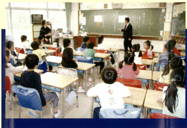
〈管理職と担任とのTT授業〉