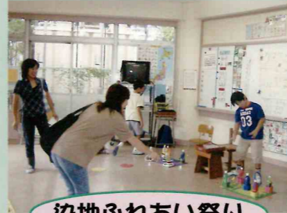
染地ふれあい祭り

岩井臨海学園6年(7/27~29) 染地ふれあい祭り(9/22) 薬物乱用防止教室(10/11) 道徳授業地区公開講座(10/15) ハチの子全校集会(10/21) 学芸会(11/11、12) 合同学習発表会 たけのこ(12/7)