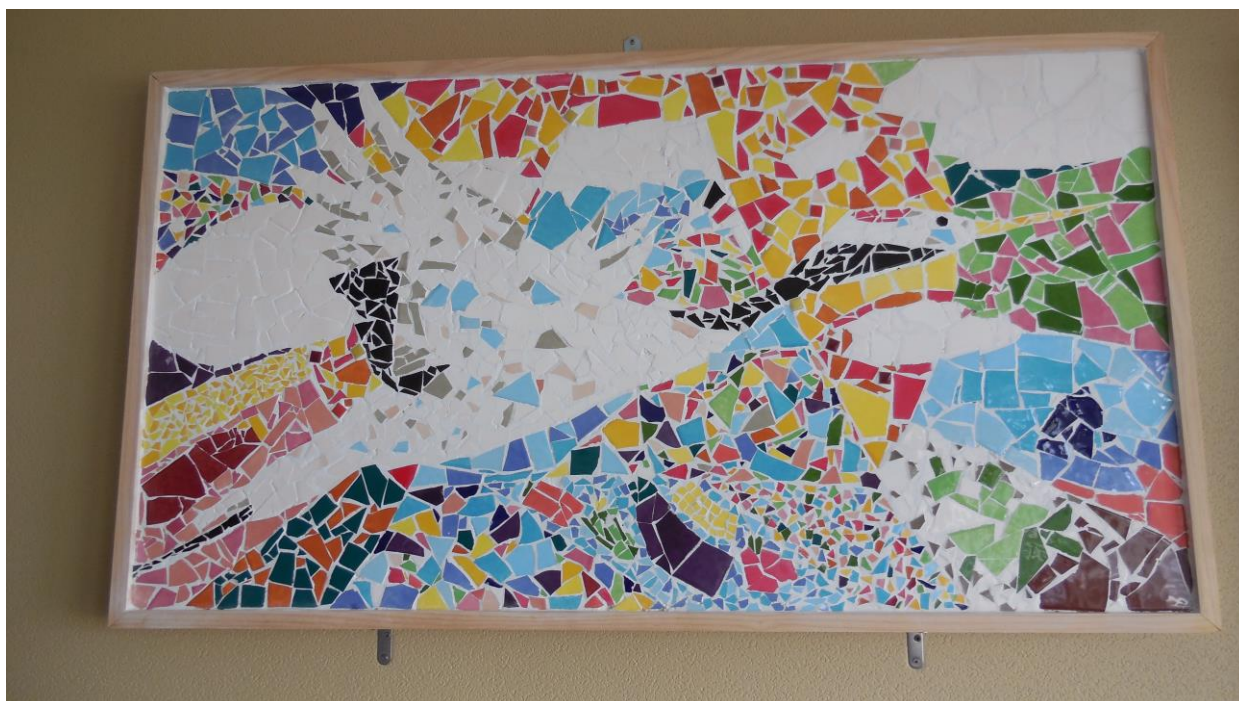
平成28年度卒業制作：モザイク画