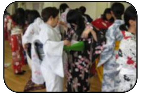
オリ・パラ「日本文化」