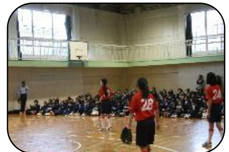
部活動ガイダンス